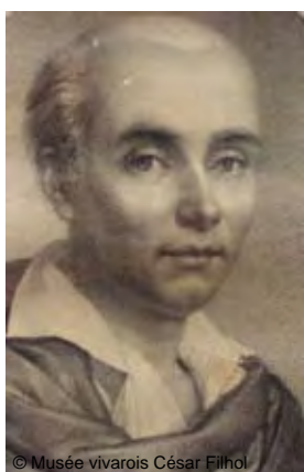
Joseph et Etienne MONTGOLFIER